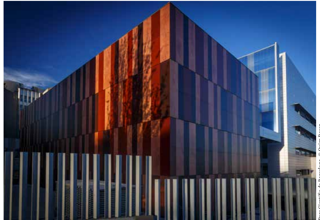
Parc Científic de Barcelona.

Durant el segle XIX, amb la industrialització i la gran onada de població consegüent, es va començar a desenvolupar a marxes forçades tot un nucli nou al voltant de la parròquia de Sant Ramon, amb nous habitatges, negocis i fàbriques. Paral·lelament, i aprofitant els terrenys d'un antic mas, s'inicià la construcció de la nova Casa Provincial de la Maternitat i Expòsits de Barcelona, un recinte assistencial projectat amb l'objectiu de millorar les condicions d'atenció i vida dels infants i les mares. Aquests dos fenòmens són els que donen nom a l'actual barri, hereu, doncs, d'aquest passat rural tan important per al desenvolupament de la zona, però també de les innovacions científiques i tecnològiques que la industrialització va portar a Barcelona.