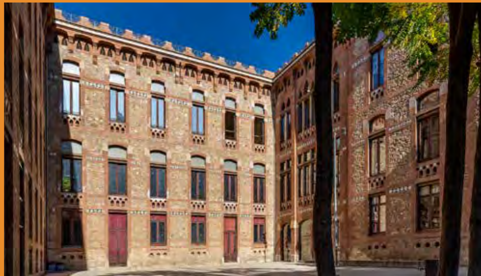
El CAP Les Corts, l'hospital de la Maternitat i l'arxiu històric de la Diputació de Barcelona.

L'objectiu principal de la Casa Provincial de Maternitat i Exposits era, però, la cura dels infants. Per millorar-ne les seves condicions de vida no era suficient amb el simple trasllat a uns edificis moderns allunyats de la hiperpoblació de Barcelona amb jardins on esbargir-se, sinó que calia incidir en altres aspectes.